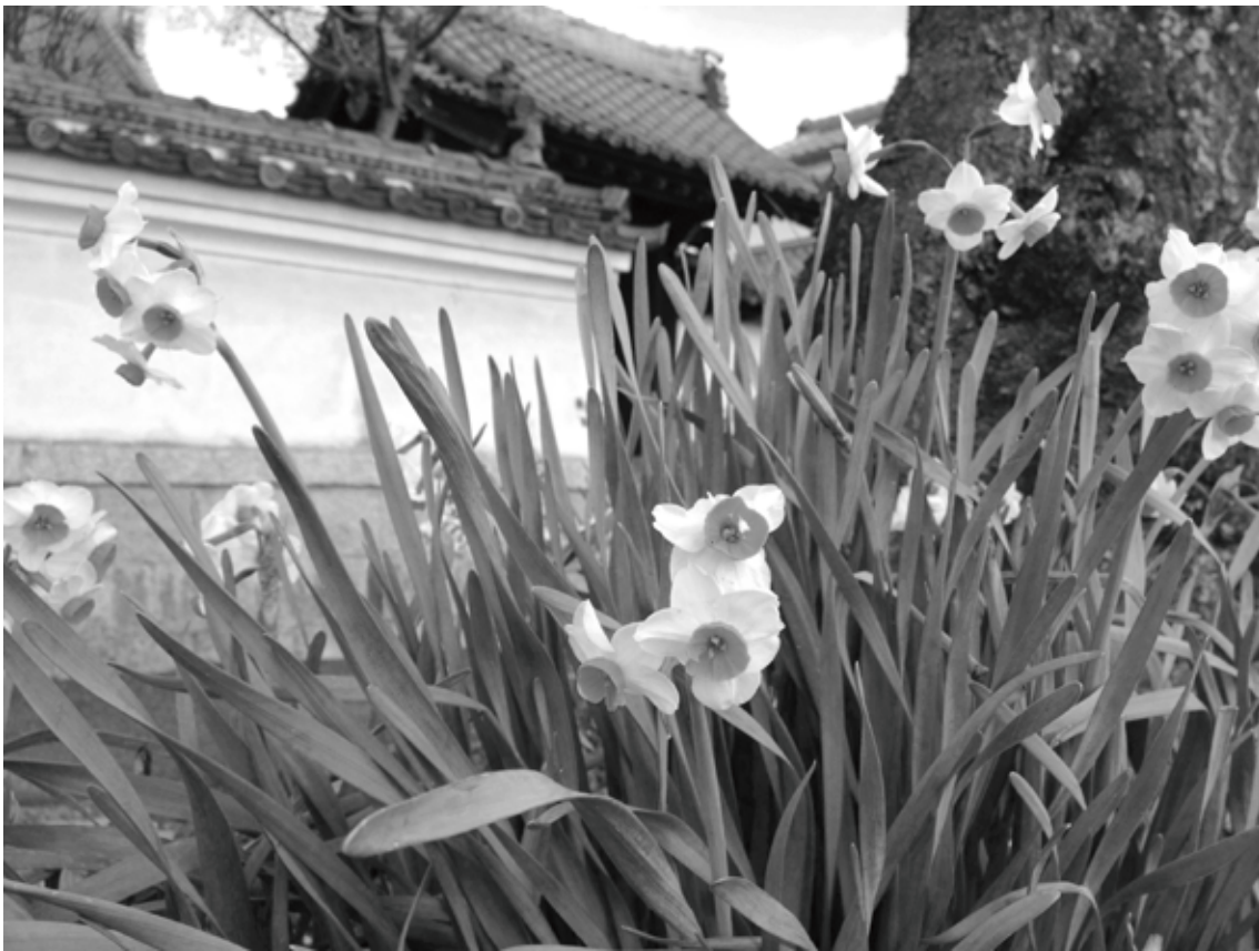
門前に咲くスイセンの花。春はもうすぐそこまで来ています。(2014/03/08)

三月だというのに、雪が舞っています。寒さ暑さも彼岸まで。言葉通り気候が落ち付くといいいのですが、どうでしょうか。